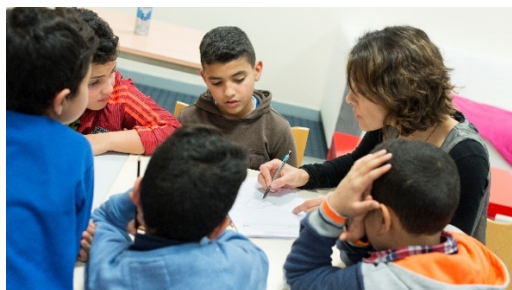
Ma Chance Moi Aussi

EDUCATION [3 projets soutenus en 2019] | Pour réduire les inégalités en matière d'éducation et favoriser l'autonomisation des bénéficiaires pour en faire des citoyens acteurs de leur vie.