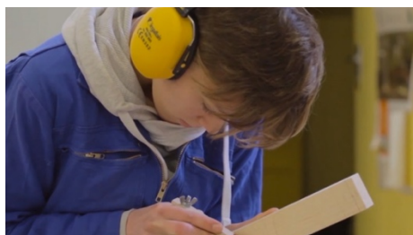
Projet « Réussir Angers » - Les Apprentis d'Auteuil

BGE Touraine (37) – Apprentis d'Auteuil (49) – Ikambere (93) - Maison Intercommunale de l'Insertion et de l'Emploi (77) – SolidarAuto 37 (37) – Drop de Béton (33) – CoopConnexion (62) – Maison de l'Emploi du Pays d'Arles (13) – Plaine de Vie (95) – Initiatives 77 (77) – Les Amis des Marais du Vigueirat (13)