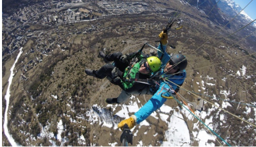
Comme les autres

SANTÉ [2 projets soutenus en 2019] | Pour lutter contre les conséquences d'une maladie ou d'un accident par le maintien en bonne condition physique et psychologique et la lutte contre le repli sur soi.